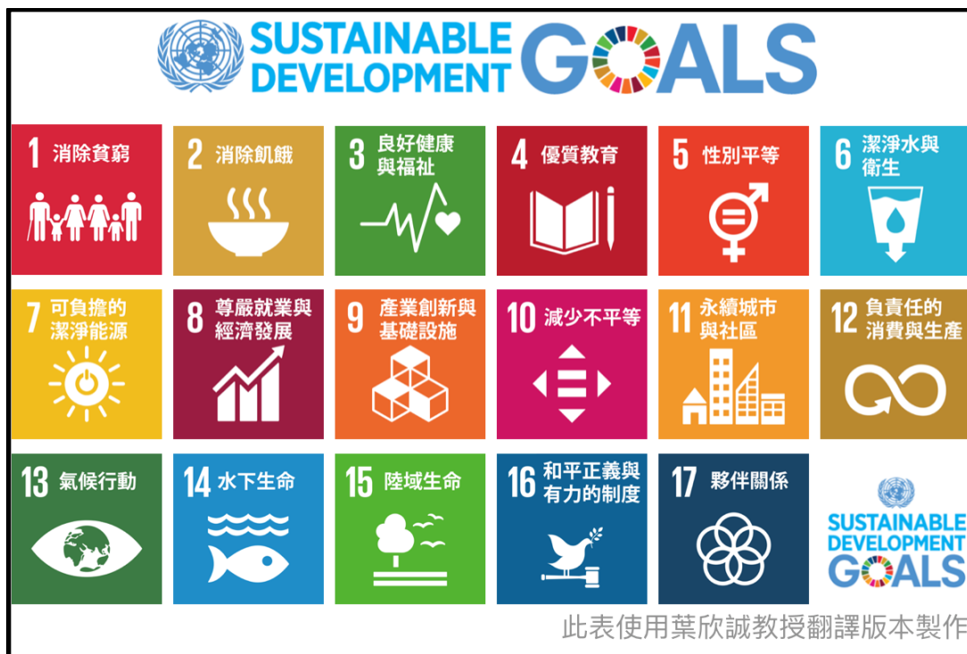
圖 3、17 項永續發展目標與食物及農業的關聯 ( https://www.foodiedu.org/project/757 )