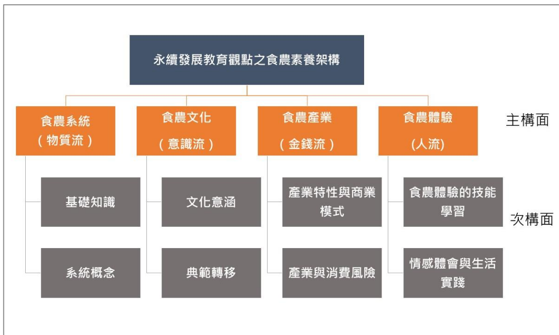
圖 2、永續發展教育觀點之食農素養架構